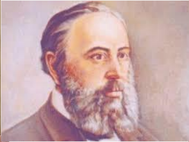
ЧУБИНСЬКИЙ ПАВЛО ПЛАТОНОВИЧ

ЗАПИСАВ БЛИЗЬКО ЧОТИРЬОХ ТИСЯЧ ОБРЯДОВИХ ПІСЕНЬ, БАГАТО КАЗОК, ЗВИЧАЇВ, ОБРЯДІВ.