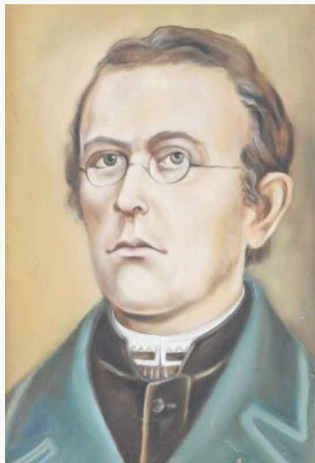
ВЕРБИЦЬКИЙ МИХАЙЛО МИХАЙЛОВИЧ

АВТОР СИМФОНІЙ, ХОРІВ, МУЗИКИ ДО ОПЕРЕТ .